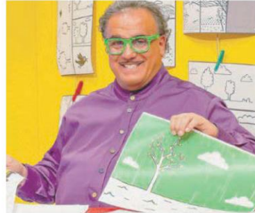
PROGRAMMA Processi educativi anche per gli adulti

«Tutto quello che facciamo per l'infanzia, come Rai Yoyo, è dedicato al mondo del bambino. Di questo mondo fa parte anche il bambino fragile, un bambino che ha delle capacità diverse da un altro bambino. Sono abbastanza stufo di sentir parlare