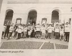
Ragazzi del gruppo iFun